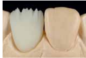
スタンダード ビルドアップ法